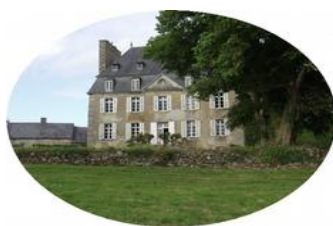
Les gites du domaine de Kerhir