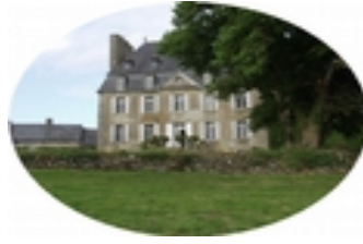
Les gites du domaine de Kerhir